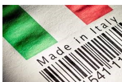
Immagine puramente illustrativa

Norma di riferimento UNI EN 13163:2017 ed UNI EN 13499:2005